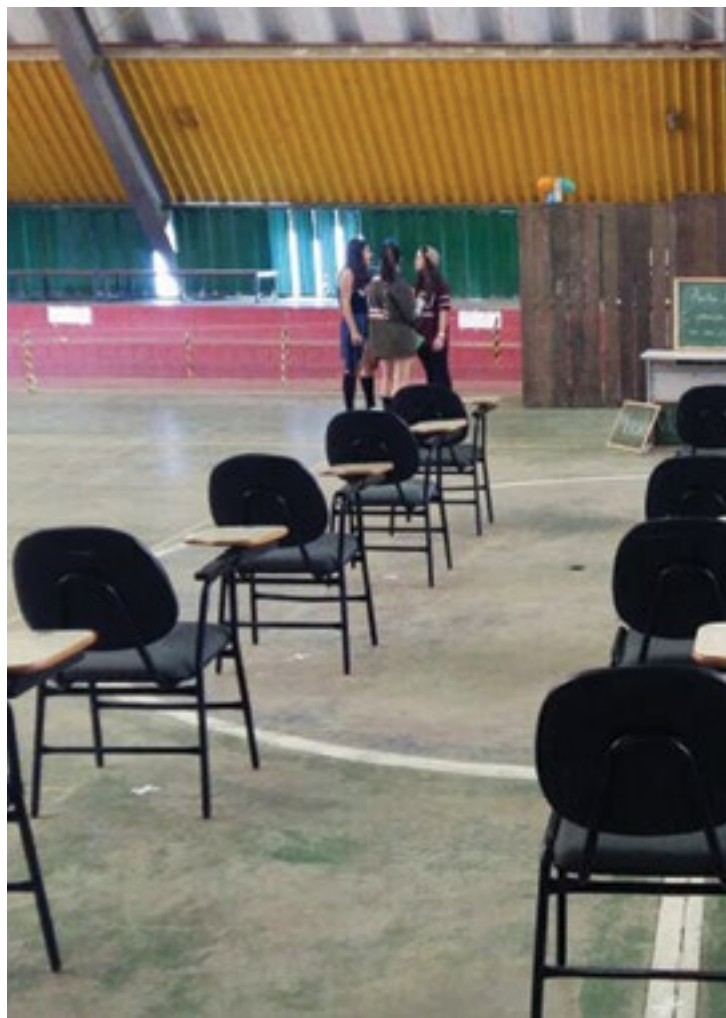
Preparação da quadra da Escola Conselheiro Mafra para a

Nos surpreenderam dizendo que demos a eles uma nova forma de ler Prometeu e que, além de tudo, levávamos narrativas da sociedade, como a da elite financeira mundial, que manipula os humanos. Que dávamos aula sobre desconstrução e transformação em uma sociedade onde a violência é muda. “Uma peça jovial, porém não