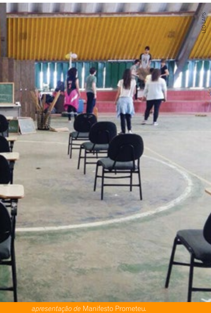
apresentação de Manifesto Prometeu.

No momento em que estávamos apresentando, pensei que a peça não estava rolando. Imaginei, em alguns momentos, que o calor da peça não estava chegando às pessoas daquele galpão, isso me deixou curioso. Percebi que o elenco também sentiu a diferença e implicitamente essa atmosfera, até então estranha para nós, afetou a forma com que nós deveríamos comunicar a peça. Foi transitando de um lugar supostamente