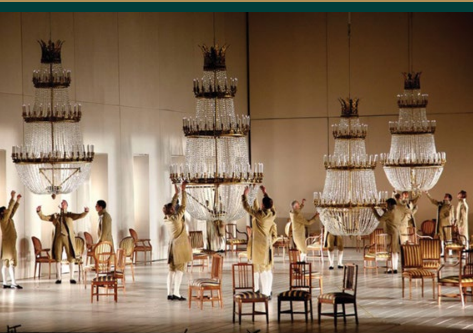
Stanislavsky and Nemirovich-Danchenko Moscow Music Theatre