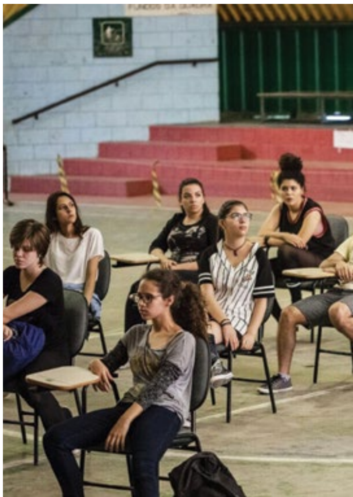
Apresentação de Manifesto Prometeu na quadra da Escola

mas com alguns elementos indispensáveis, tais como: título, identificação e análise do problema, argumentos que fundamentam o ponto de vista do(s) autor(es), local, data e assinaturas dos autores. Esse gênero foi, no teatro, de certa forma, colocado em segundo plano por volta dos anos 1990 e 2000, como sendo um tipo “menor”, “mais pobre”, muitas vezes pejorativamente rotulado como “panfletário” etc. Mas que vem agora revisitado, nos últimos anos, retornando com