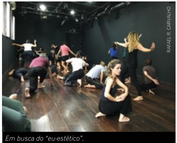
Em busca do “eu-estético”.

14. “Eu-estético”. Exercício onde todos os participantes se colocam no espaço e propõem uma série de movimentos em que buscam um caminho para experimentação. Em um primeiro momento, se propõe movimentos apenas com o braço direito. Propõe-se que realizem um caminho com começo, meio e fim, mas que não deve ser uma ação, e sim um exercício onde de fato depositem seu “eu-estético”. Para fortalecer a compreensão desse “eu-estético”, propõe-se que com o braço esquerdo realizem movimentos mecânicos em oposição ao outro, que faz movimentos estéticos. Um lado produzindo movimentos vulgares ou mecânicos, como ele chama, e o outro buscando identificar o fazer estético e como ele está em todo o corpo e não apenas no braço ou nas mãos. “Busquem que o movimento seja interno. Porém, não existe uma motivação psicológica.” Após algum tempo de experimentação, trocam-se os lados, o braço direito passa a fazer os movimentos vulgares ou mecânicos e, o braço esquerdo, os movimentos estéticos. Depois se busca essa variação entre um e outro pelo espaço, atentando para os movimentos do rosto e do corpo todo. O movimento nasce dos braços, porém, todo o corpo responde.