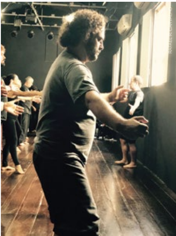
O ciclo vital.

31. O exercício começa com a prática de dois círculos no espaço olhando para o centro, em seguida, mudam para duas fileiras grandes contemplando as janelas. Todos abrindo muito os braços. Passo à frente com a perna direita, cruzando com a esquerda e fechando como se abraçassem os joelhos. Em seguida, abrir-se à luz. Pensar em uma cor. Começar pelo branco e, assim, seguir durante o movimento todo: o branco com os braços abertos e, em seguida, o amarelo, vermelho, laranja, roxo, violeta, azul, marrom, café, cinza, preto, cinza, violeta, azul, vermelho, amarelo, BRANCO e novamente repete-se o ciclo. Cores claras remetem fisicamente ao abrir e, cores escuras, ao fechar. Esse exercício contínuo favorece o lugar de vitalidade e entrega que o trabalho pede.