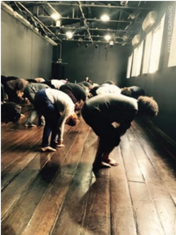
O ciclo vital