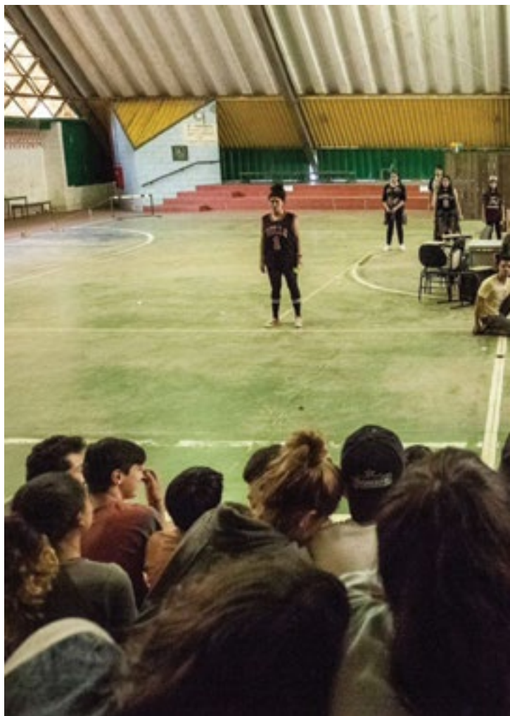
Apresentação de Manifesto Prometeu na quadra da Escola

3. Artista do Movimento e pesquisadora das Artes da Cena. Doutora em Artes pela Universidade Estadual de Campinas (UNICAMP), Mestre em Artes e Bacharel em Artes Cênicas pela mesma instituição. Especialista em Laban/Bartenieff pela Faculdade Angel Vianna (FAV). Vice-coordenadora do curso de Bacharelado em Teoria da Dança e Professora Adjunta do Departamento de Arte Corporal (DAC) da Universidade Federal do Rio de Janeiro (UFRJ). Professora dos cursos de Bacharelado em Dança, Bacharelado em Teoria da Dança, Licenciatura em Dança e Direção Teatral da UFRJ e da Pós-Graduação em Laban da Faculdade Angel Vianna.