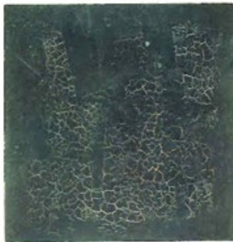
Quadrado Negro Sobre Fundo Branco (1915), de Kazimir Malevich.